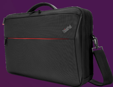
Sacoche compacte à ouverture supérieure ThinkPad Professional 35,56 cm (14")