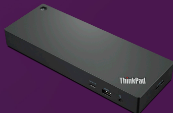
Station d'accueil pour ThinkPad Workstation Thunderbolt™ 4