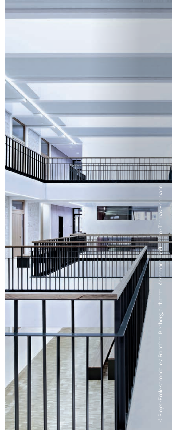
© Projet : École secondaire à Francfort - Riedberg, architecte : Ackermann Raaf photo : Thomas Herrmann