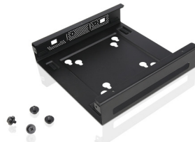
Kit de montage VESA II pour ThinkCentre Tiny Réf. : 4XFON03161