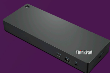
Station d'accueil pour ThinkPad Workstation Thunderbolt™ 4