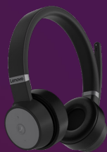
Casque sans fil ANC Lenovo Go