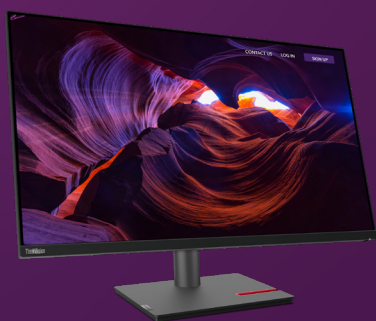
Moniteur ThinkVision P32p-30