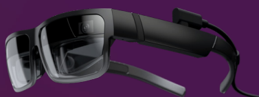
ThinkReality A3 XR1 3G+32G

Pour une liste complète des accessoires et options, rendez-vous sur : accsmartfind.lenovo.com