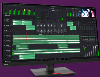
Moniteur ThinkVision P32p