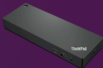
Station d'accueil Thunderbolt™ 4 pour station de travail ThinkPad