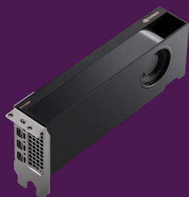
Carte graphique NVIDIA® RTX™ A2000 6